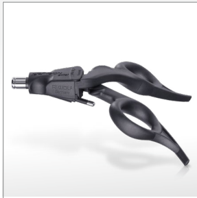
Poignée ERAGON axial sans dispositif d'arrêt, avec raccord HF ..... 83930083