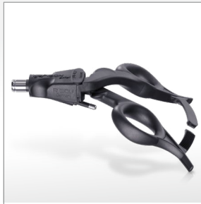
Poignée ERAGON axial avec dispositif d'arrêt, avec raccord HF ..... 83930084