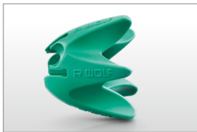
en option : Embout à manette ERAGON axial, autoclavable..... 8988